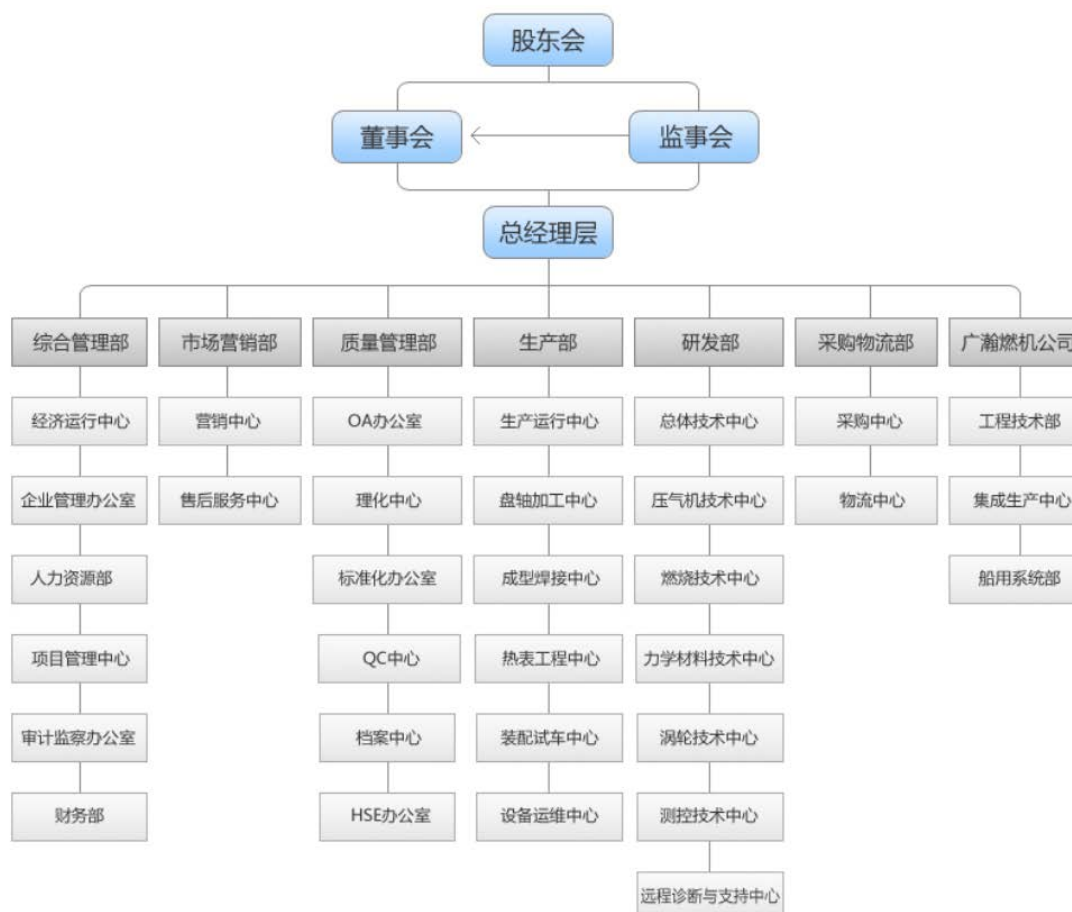
图 3-1 企业组织机构图